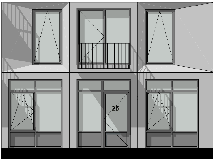
Voorgevel | Oosterhamrikkade